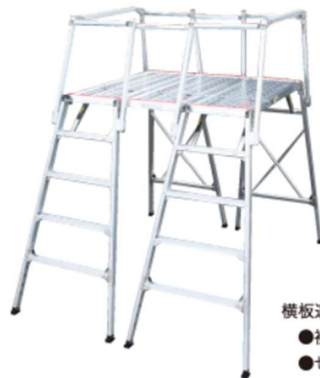
横板連結例 ● 接側ガード(SCD) ● セーフティガード(SGS-810)