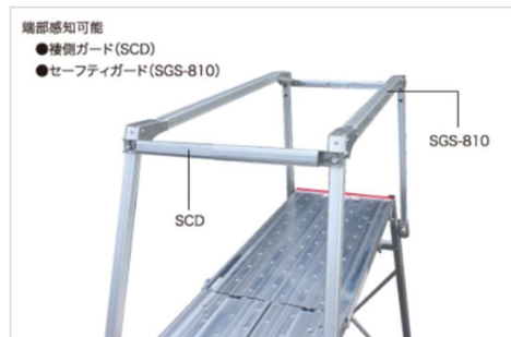
端部感知可能 ● 接側ガード(SCD) ● セーフティガード(SGS-810) セーフティガードを装着すれば、側方端部をお知らせすることができます。また、装着したまま折畳み(収納)も可能です。